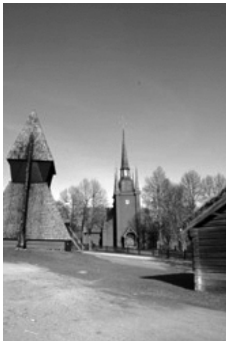
Kopparbergs kyrka från 1635