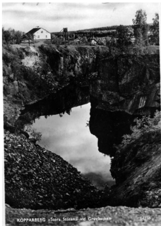
Gammalt Vykort, Stora Stöten vid Gruvbacken Kopparberg